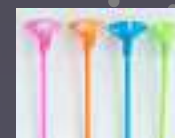
Στηρίγματα για μπαλόνια