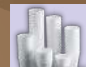
Περίεκτες ποτών από φελιζολ