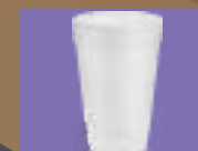
Κυπελάκια ποτών από φελιζολ