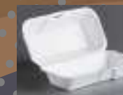
Περίεκτες τροφίμων από φελιζολ